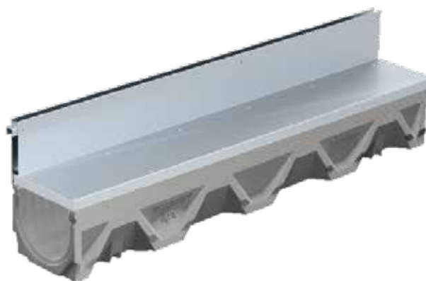
*Filcoten avvanningsrist med spaltetopp

Gessenschwandt 39 A-4882 Oberwang Østerrike